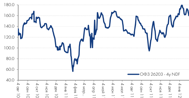
Спред ОФЗ 26203 - 4у NDF

Пенсионные средства: положительный уровень реальных доходностей